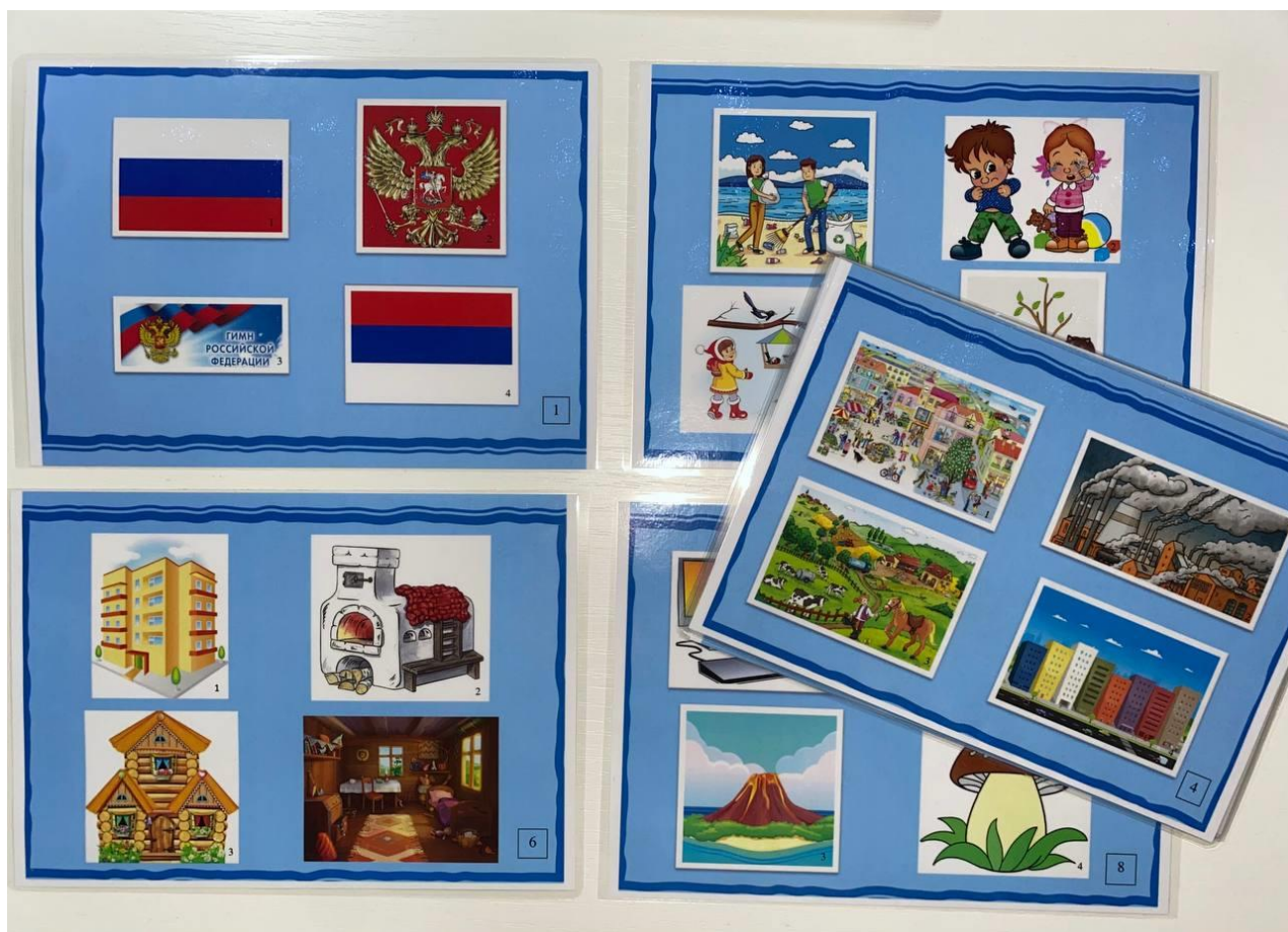
Рис. 2 Дидактическая игра «Четвёртый лишний» для раздела «Жизнь города и села»