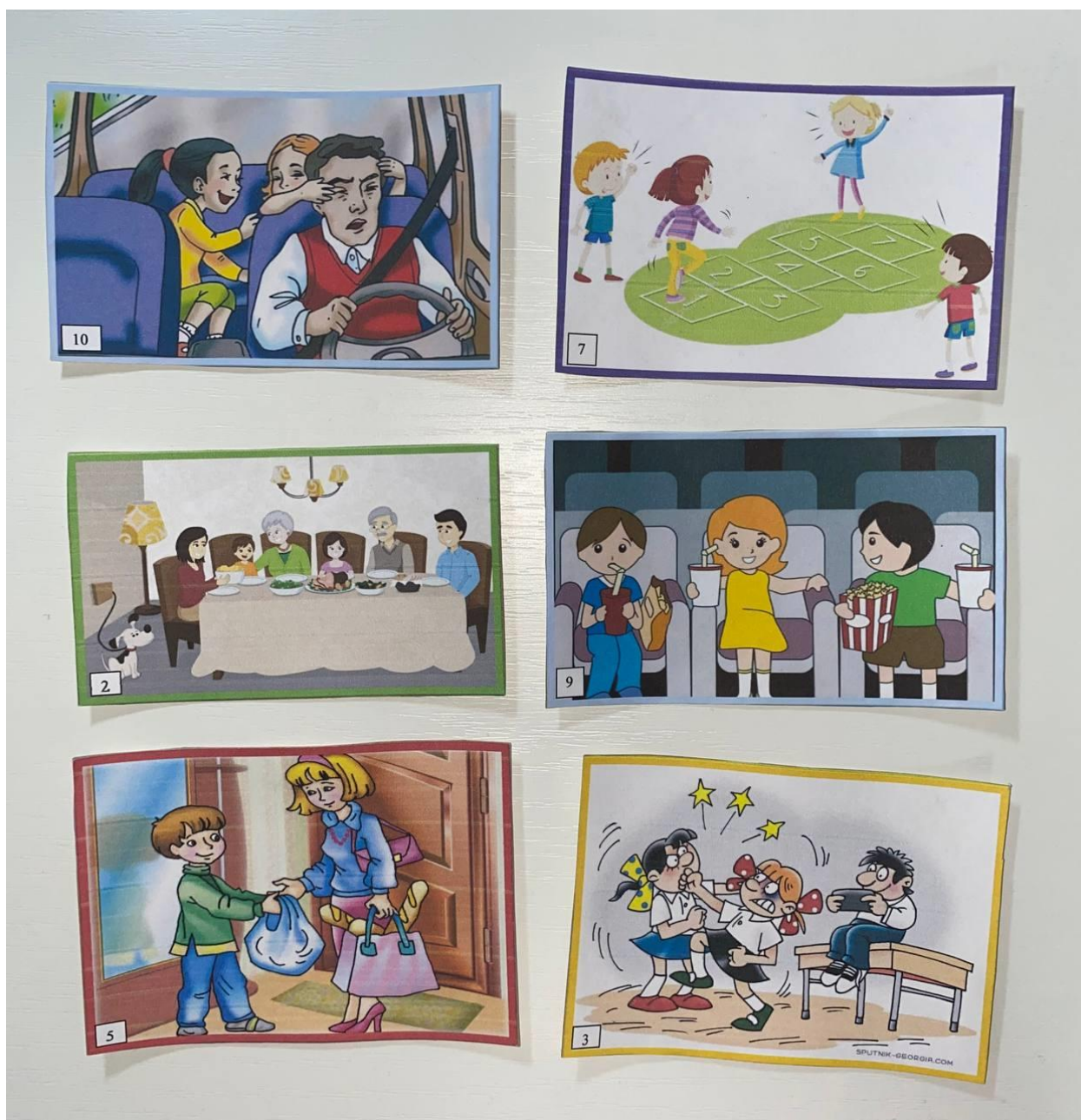
Рис. 5 Игра «Проблемная ситуация» для раздела «Общение»

На каждой карточке изображена проблемная ситуация. Ребенку предлагается взять выпавшую карточку и объяснить, что за ситуация изображена на картинке. Педагог контролирует правильность объясняемой ситуации, задает ход мыслей при возникновении у ребенка затруднений в понимании изображенной ситуации.