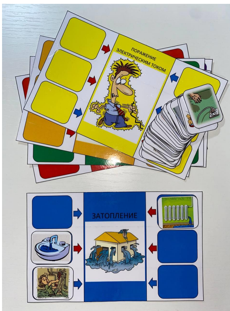
Рис. 4 Дидактическая игра «Причина и следствие» для раздела «Здоровье и безопасность»

Ведущий раздаёт игрокам одинаковое количество больших карт, маленькие карточки перемешивает и оставляет себе. Затем показывает игрокам по одной карточке. Тот, кому подходит карточка, говорит: "Мне нужна эта карточка, т. к. я собираю всё, что относится к пожару". Прежде чем положить карточку на большую карту, подумайте, где причины, а где следствия. Причины кладите на карту к стрелкам красного цвета, а следствия - к стрелкам синего цвета. Обсудите вместе с ведущим, что послужило причинами бедствий, как нужно вести себя в возникших ситуациях и как постараться избежать этих ситуаций.