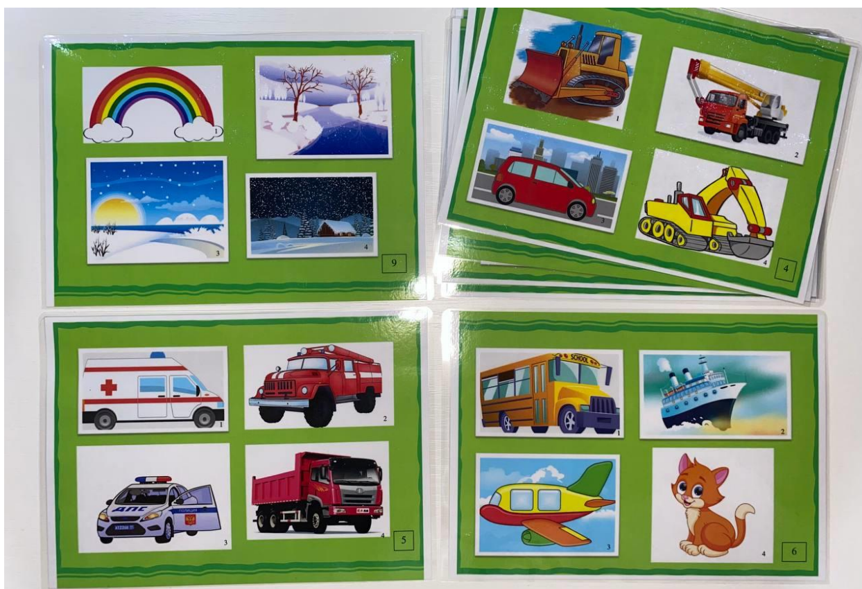
Рис. 1 Дидактическая игра «Четвёртый лишний» для раздела «Где мы живем»

Игра состоит из: набора ламинированных карточек, на каждой карточке изображены 4 предмета, 3 предмета связаны общим признаком, а 4-й – лишний. Можно играть как с одним ребенком, так и с группой детей. Ребенку предлагается любая из карточек. Он должен посмотреть и выделить среди рисунков карточки, три из которых классифицируются по одному признаку, один лишний предмет, который не подходит под единую классификацию. Ребенок должен объяснить свой выбор.